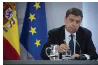
Luis Planas, Ministro de Agricultura

Deben realizar en su explotación alguna actividad relacionada con al menos uno de los siguientes objetivos: economía circular, gestión de nutrientes, uso eficiente de los recursos, o producción respetuosa con el medioambiente y el clima. En estos casos el beneficiario presentará una declaración responsable con el compromiso de realizar alguna de dichas actividades.