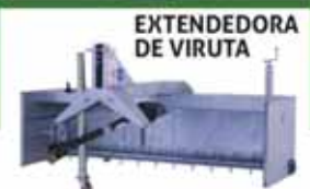
EXTENDEDORA DE VIRUTA