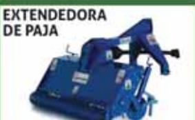
EXTENDEDORA DE PAJA