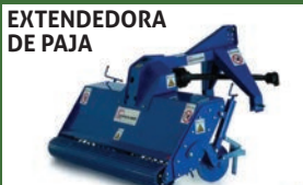
EXTENDEDORA DE PAJA