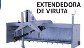
EXTENDEDORA DE VIRUTA