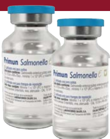
Primun Salmonella E

Siempre habrá alguna oveja negra agroalimentaria o alguna noticia sensacionalista, aprendamos a vivir con ello, mejorando la red de alertas aprendiendo de las posibles carencias que han sucedido con esta crisis, condenando penalmente al delincuente agroalimentario y contrarrestemos las intoxicaciones o exageraciones informativas cogiendo el toro por los cuernos y aportando información veraz y contrastada de cómo producimos nuestros huevos y nuestra carne de ave.