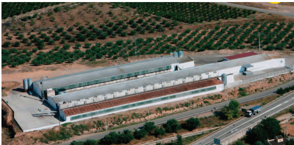
Granja de ponedoras de dimensión superior a 40.000 gallinas.

Las MTD se deben aplicar a las granjas avícolas intensivas con de más de 40.000 plazas, aunque es recomendable su