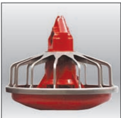
Comedero MODELO C2® PLUS bajo