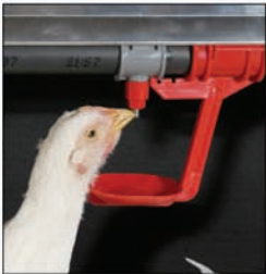
Bebedero de nipple con recuperador