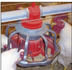
Comedero para gallos REVOLUTION®