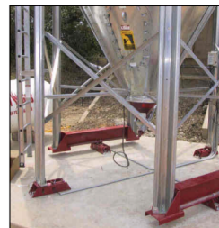
Silos con células de carga