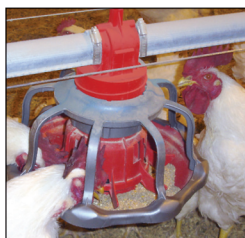
Comedero para gallos REVOLUTION®