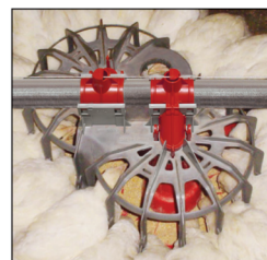
Comedero GENESIS® para recría