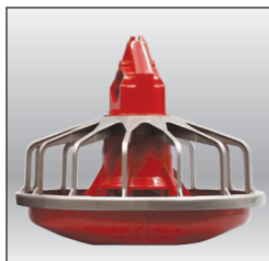
Comedero MODELO C2® PLUS bajo