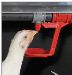
Bebedero de niple con recuperador

Esta nueva edición consolida a "Gui@Vet" tras más de 30 años, como una herramienta esencial para el trabajo de los profesionales veterinarios, pues en ella encuentran todos los productos necesarios para hacer frente a las distintas enfermedades animales, además de poder a través de ella, expedir recetas y por tanto agilizar y facilitar su labor profesional y sanitaria, todo en aras de una mejor sanidad animal y por tanto de una mejor sanidad pública. •