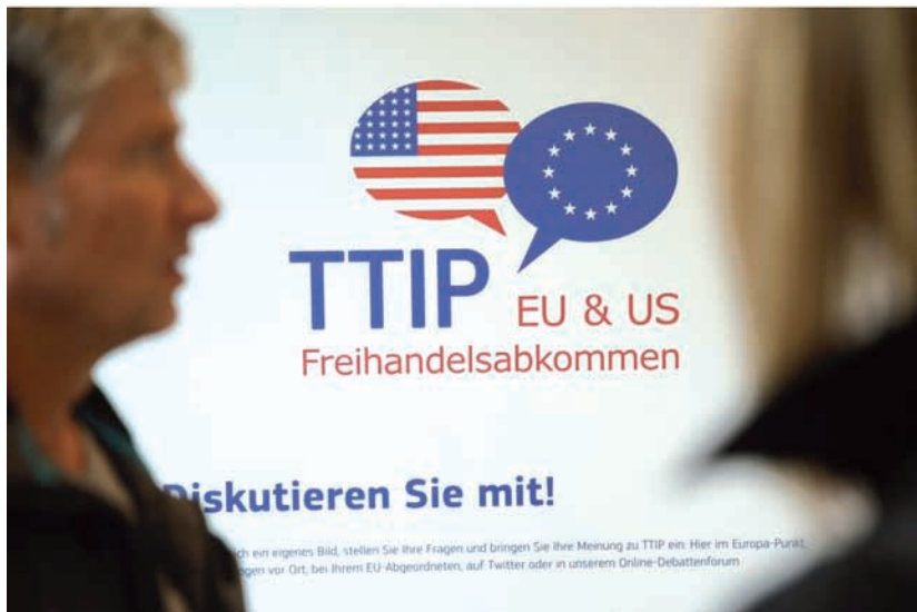
Décima ronda de encuentros entre EE.UU y la UE para abordar el TTIP

En temas relacionados con los sectores ganaderos no se contemplan las cuestiones de bienestar animal ni los demás costes