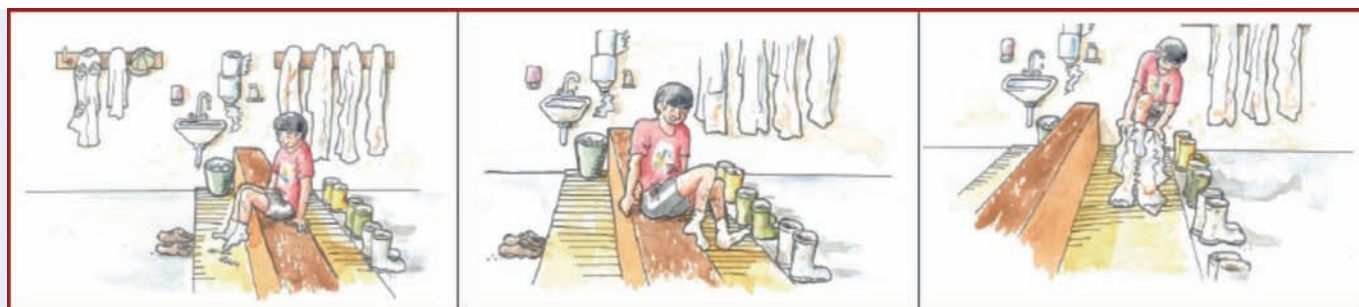
Fig. 1. Distribución de la antesala: la zona limpia es la zona de acceso a los pollos, la sucia es la de acceso desde el exterior de la nave.

mente ha sido necesario realizar un recordatorio a los ganaderos, remarcando la importancia de cada actuación, y los beneficios de llevarlas a cabo correctamente.