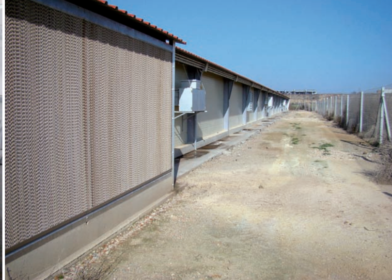
Vallado perimetral en una granja.