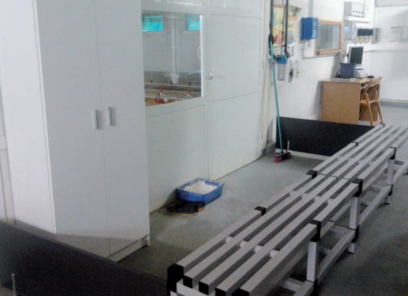
Antesala con división en zona limpia (donde está el pediluvio y el armario) y zona sucia (resto de antesala).