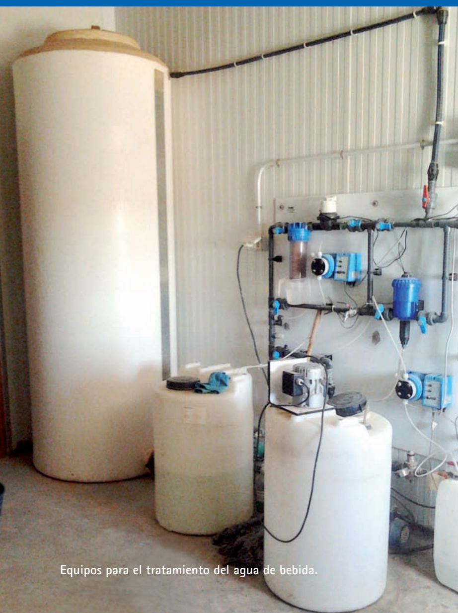
Equipos para el tratamiento del agua de bebida.

LI Symp. de la AECA-WPSA. Valencia, 2/3-10-2014