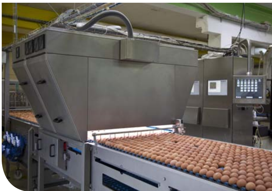
Transportador de rodillos.

Aumentando la capacidad hasta 108.000 huevos/hora, la STAALKAT ARDENTA 300 disminuye el coste unitario del huevo envasado, lo que aumentará sus ganancias. Su sistema operativo más moderno sustituye las placas de circuitos impresos más frágiles, lo que contribuye a obtener una clasificadora todavía más fiable.