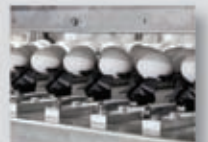
Zona de inserción simple y eficiente.