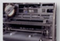
Robustez a lo largo de la máquina.