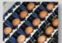
Detector de fisurados lavable sin ningún desgaste.

■ Fácil de manejar con el programa EGG-it Touch que permite al operario monitorizar todo el proceso y realizar en cualquier momento las modificaciones necesarias.