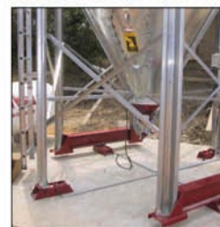
Silos con células de carga