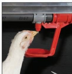
Bebedero de niple con recuperador

En estos momentos la UE tiene abiertas negociaciones comerciales con varios países. Con Canadá están casi cerradas y solo se incluyen los huevos para incubar. En el caso de India, un importador de yema en polvo a la UE, se tratará de que esta sea considerada producto sensible. Las negociaciones con este país se han parado por las elecciones que celebran este mes. México está revisando el acuerdo comercial actual. La UE no lo considera un riesgo en nuestro sector, ya que llevan dos años importando -por la incidencia de los brotes que han tenido de influenza aviar-, pero la situación podría cambiar pronto. Japón es otro país con el que se han abierto ya las negociaciones, en este caso con una posición ofensiva de la UE, gran exportadora de albúmina a ese destino.