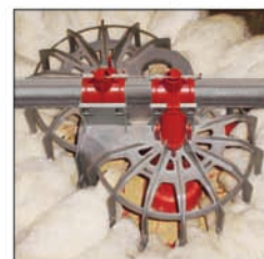
Comedero GENESIS® para recria