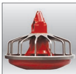
Comedero MODELO C2® PLUS bajo