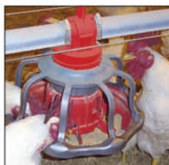
Comedero para gallos REVOLUTION®