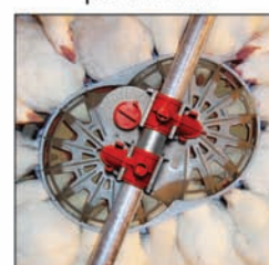
Comedero GENESIS® para reproductoras