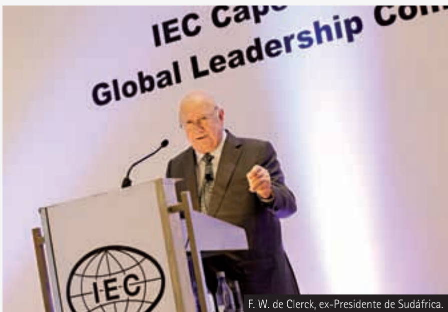
F. W. de Clerck, ex-Presidente de Sudáfrica.

desempeñado un papel cada vez más prominente en cuanto a producción de huevos pues para 2011 casi las dos terceras partes de los producidos globalmente procedían de este continente. Con vistas al futuro, estos autores piensan que los niveles de producción de huevos estarán estrechamente dictados por la demanda y que cabe esperar un aumento de la producción en África y Asia a medida que la población de estas regiones siga creciendo.