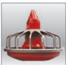
Comedero MODELO C2® PLUS bajo