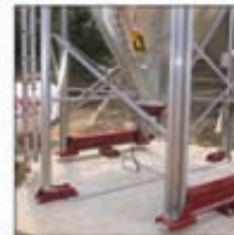
Silos con células de carga