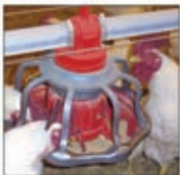
Comedero para gallos REVOLUTION®