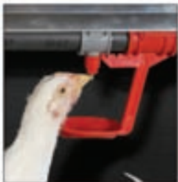
Bebedero de niple con recuperador