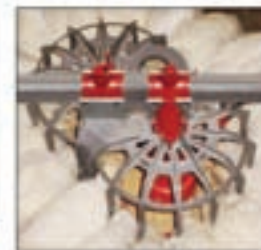
Comedero GENESIS® para recria