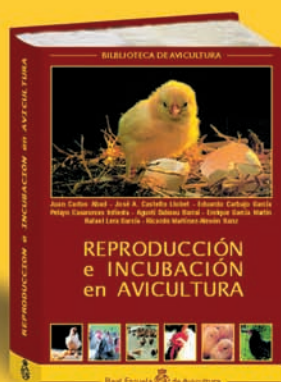
REPRODUCCIÓN E INCUBACIÓN EN AVICULTURA