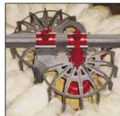
Comedero GENESIS® para recría