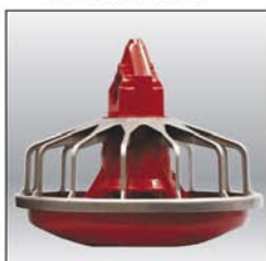
Comedero MODELO C2® PLUS bajo