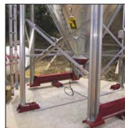
Silos con células de carga