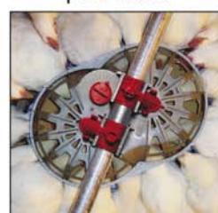
Comedero GENESIS® para reproductoras