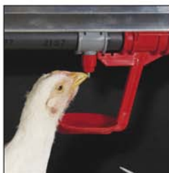
Bebedero de nipple con recuperador