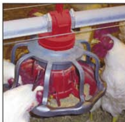
Comedero para gallos REVOLUTION®