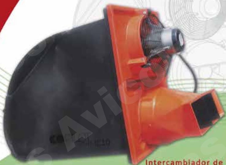
Intercambiador de calor COPILOT IC10

COPILOT System, el especialista en control ambiental para su granja