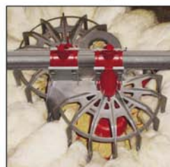
Comedero GENESIS® para recria