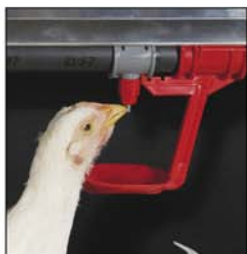
Bebedero de nipple con recuperador

Para información adicional: Bayer HealthCare http://www.bayervet.net