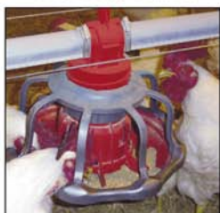
Comedero para gallos REVOLUTION®