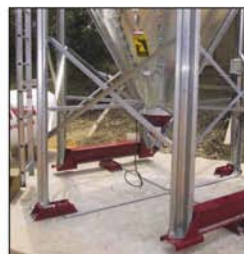
Silos con células de carga