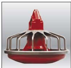
Comedero MODELO C2® PLUS bajo