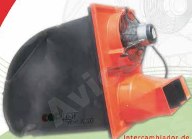
Intercambiador de calor COPILOT IC10

COPILOT System, el especialista en control ambiental para su granja