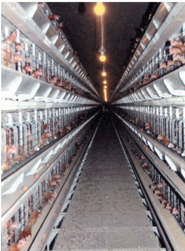
A la baja tensión, la iluminación real es de color amarillo anaranjado, tranquilizante para las gallinas

compra que la fluorescente compacta, pero su eficacia energética es muy superior y con una muy larga duración de vida. Además no contiene mercurio (*), lo que constituye un criterio de compra importante, subraya el criador. Yo comercializo cerca de 43 millones de huevos al año y no puedo correr el peligro, por pequeño que sea, de encontrar indicios de este metal en uno de los lotes". Siendo reciente la instalación eléctrica del edificio de 82.000 plazas – se trata de una construcción del 2007 –, la inversión se limitó a la compra de 322 lámparas a 35 € la unidad. La intensidad eléctrica es mucho menor que con las bombillas incandescentes. De hecho, de los ocho variadores de 140 amperios en total, en la actualidad solo funcionan dos de 10 amperios: uno para la iluminación de los cuatro pisos inferiores y otro para la parte superior – 8 niveles de jaulas separadas por un piso –.