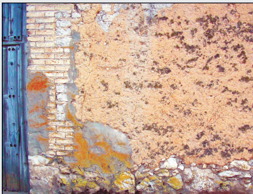
Fig. 2. Pared construida con piedra, ladrillo y adobe

Es curiosa esta forma de construcción, de mezclar piedra, con ladrillos y adobes y la encontramos de forma habitual en construcciones de la zona, como se puede ver en la Figura 2. Así, pueden tener un color marrón por la tierra, blanco si está encalado o incluso con algún remache de cemento si ha sido desafortunadamente reconstruido.