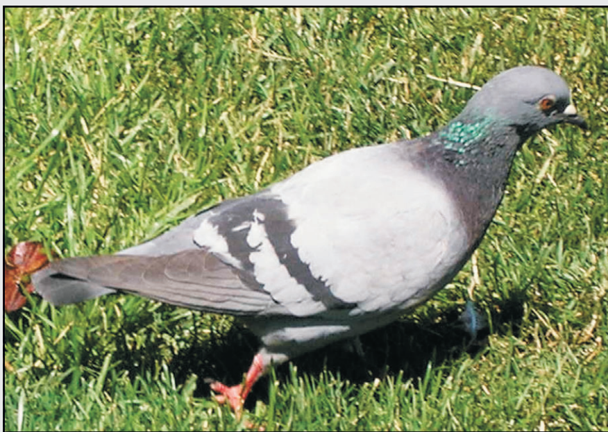
Fig. 1. Paloma en Tierra de Campos

Tierra de Campos, con conjunto de llanuras suavemente onduladas, interrumpidas a veces por algunos cerros de cumbres aplanadas y de laderas en suave declive, tiene una belleza inigualable debida a sus palomares palentinos de barro, de piedra o de ladrillo.