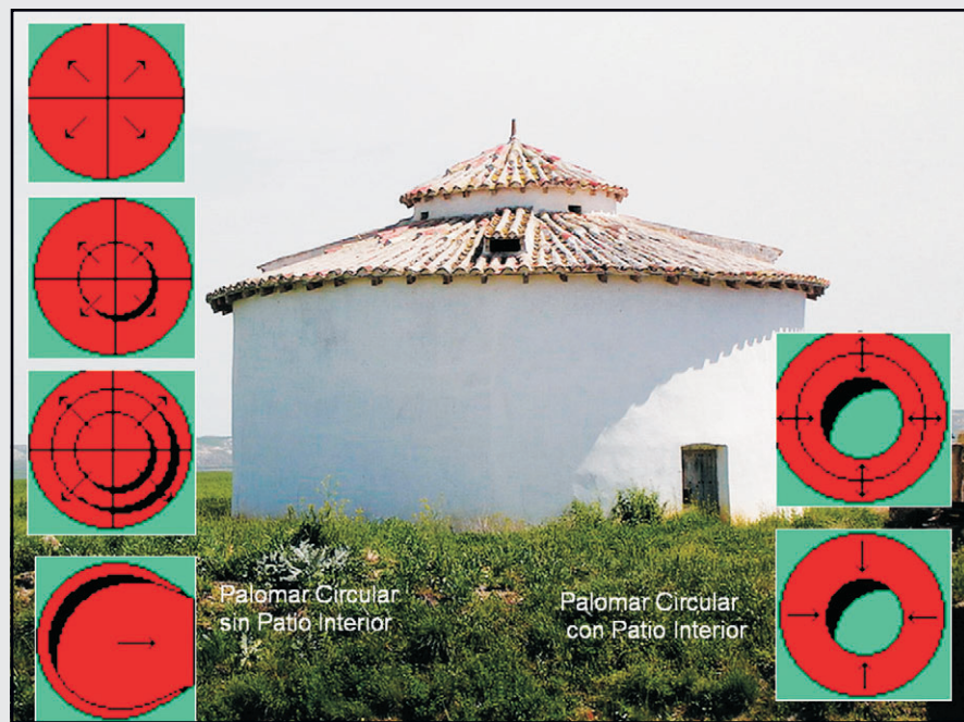
Fig. 3. Palomares circulares