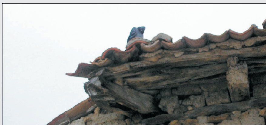
Fig. 7. Paloma con frío en Tierra de Campos.

implantación. El pichón de Tierra de Campos es más pequeño pero su carne roja es muy sabrosa y jugosa cuando la alimentación natural y los cuidados han intervenido en su cría y en el estado sanitario del palomar.