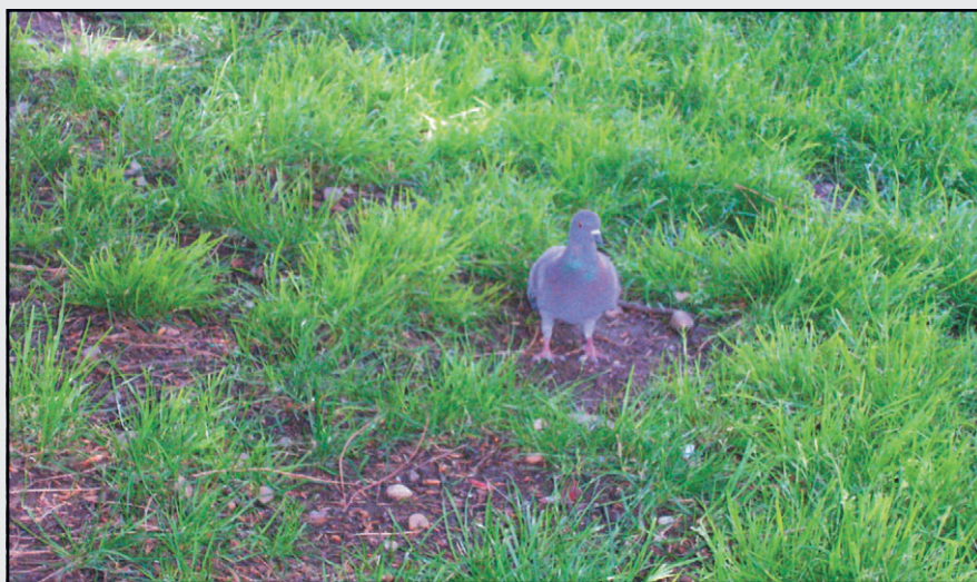
Fig. 6. Paloma en las cercanías de un palomar

implantación. El pichón de Tierra de Campos es más pequeño pero su carne roja es muy sabrosa y jugosa cuando la alimentación natural y los cuidados han intervenido en su cría y en el estado sanitario del palomar.