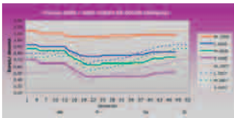
Evolución del mercado avícola en España Año 2008