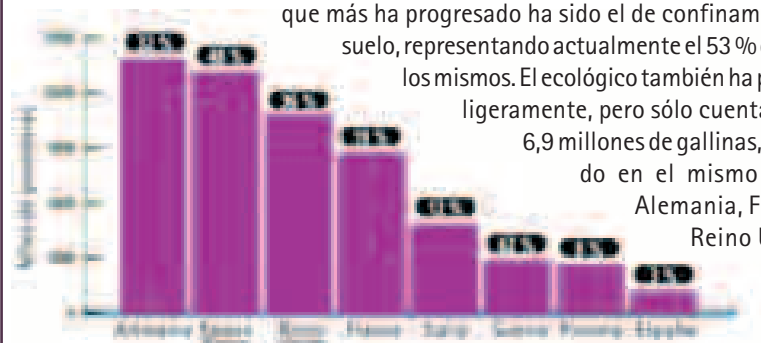
% de ponedoras en sistemas alternativos en la UE.

En los últimos 10 años, entre los sistemas alternativos el que más ha progresado ha sido el de confinamiento en el suelo, representando actualmente el 53 % del total de los mismos. El ecológico también ha progresado ligeramente, pero sólo cuenta con unos 6,9 millones de gallinas, destacando en el mismo 3 países: Alemania, Francia y el Reino Unido. ●