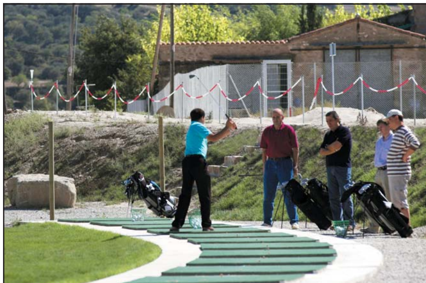
Los visitantes ya pueden disfrutar de las instalaciones del nuevo campo de pitch&putt "bonÀrea", situado en Massoteres.

El campo de golf "bonÀrea" dispone de 18 hoyos —par 3— con longitudes que oscilan entre 70 y 115 m, así como de un campo de prácticas. El riego de estas instalaciones se realiza íntegramente mediante