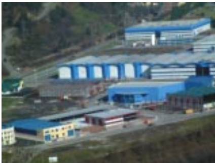
Polígono de Vega de Baíña

Según una noticia de Agencia del pasado 26 de junio, la compañía Ovo Foods pondrá en marcha una factoría en el polígono de Vega de Baíña, en Mieres, dedicada a la producción de derivados del huevo para los sectores de pastelería, alimentos precocinados y cocina industrial, que supondrán una inversión de 14 millones de euros y generará 50 empleos.