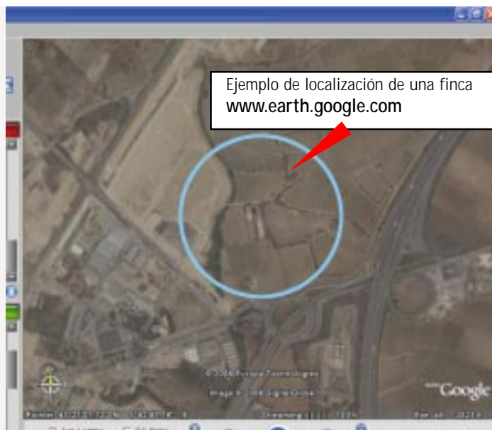
Ejemplo de localización de una finca

En definitiva, se trata de un programa con infinidad de utilidades que les recomendamos comprobar: les aseguramos que no les dejará indiferentes. ¡Bienvenidos al futuro! ●