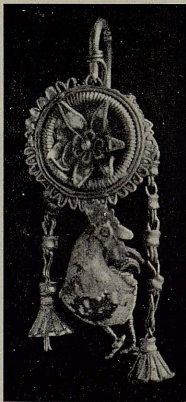
Joya Etrusca del siglo III antes de Jesucristo. Museo del Vaticano.

El mismo Dios, cuando en su universal castigo dispuso que se salvaran los que con Noé le fueron fieles, quiso también salvar a los irracionales dándoles cabida en el Arca. Al venir al mundo, quiso hacerlo en humilde pesebre, y que el Niño-Dios se abrigara al calor del suave aliento de dos de sus moradores. Cuando