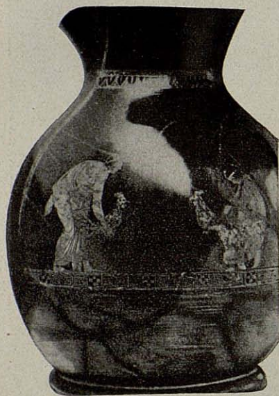
Vaso Etrusco del siglo V antes de Jesucristo. Museo del Vaticano.

maravillosas esculturas que decoran el grandioso Templo de la Sagrada Familia que está construyéndose en Barcelona. En lo que de él