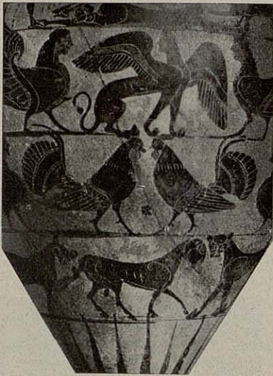
Vaso griego - Siglo VI antes de Jesucristo. — Museo del Capitolio. — Roma.