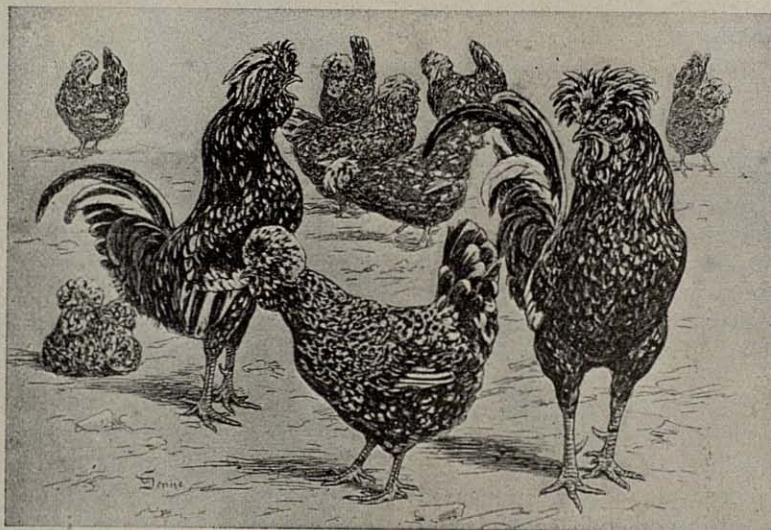
Apuntes del natural tomados por el dibujante Denise; de los gallos y gallinas Houdan de los Establecimientos Duperray, de Meulette-Houdan (Serie et Oise), agraciados con el Premio de Honor en razas francesas en la Exposición de París de este año.

En los días 14 al 19 del pasado mes de febrero se celebró en los Palacios de Exposiciones de la Puerta de Versalles, de París, la setenta y unaava Exposición internacional de Avicultura organizada por la Asociación Central de Avicultura de Francia, bien llamado Salón Internacional de la Avicultura.