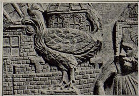
Sarcófago particular romano. Museo Laterano

peen esculturas representativas de animales domésticos.