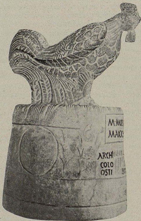
Urna cineraria. — Mus.º Lateranense

No hay para qué recordar que los babilonios y los egipcios no fueron menos aficionados a esto, porque no hay vestigio de las construcciones de aquellos pueblos en los que no cam-