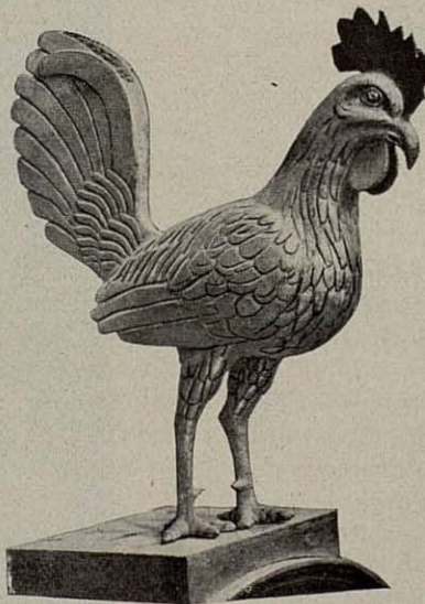
Gallo de la Torre del Campanario en la Basílica de San Pedro de Roma (Ciudad Vaticana)