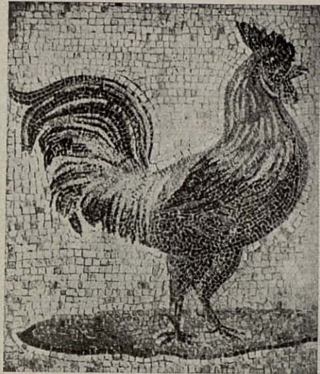
Mosaico románico encontrado en las Termas de Diocleciano. — Museo Nacional de Roma.