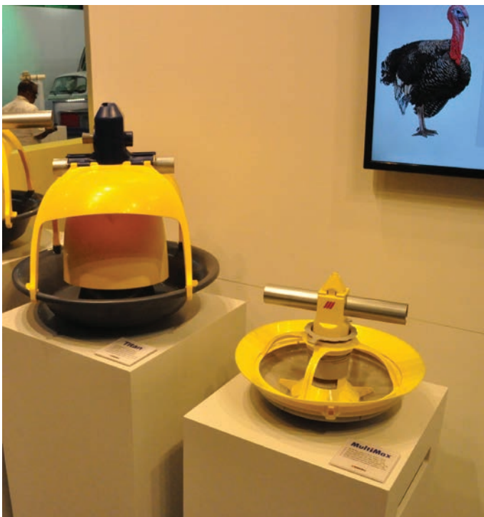
Roxell, distribuido en España por New Farms, presentó su nuevo comedero XL para pavos, el "Titan" (a la izquierda), junto sus otros modelos en uso cómo el "MultiMax" (a la derecha)

Otro laboratorio, el holandés Hotraco Agri , presentaba su sistema "MiteAlertR", de contaje de los piojos rojos de las gallinas, basado en la colocación de unos aseladeros especiales en determinados lugares de las naves de puesta, en los cuales se esconden estos parásitos, para que el criador, a la vista de esta información en su ordenador, decida el momento más adecuado para el tratamiento de la plaga.