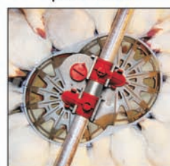
Comedero GENESIS® para reproductoras