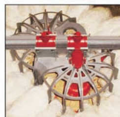
Comedero GENESIS® para recria