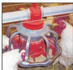
Comedero para gallos REVOLUTION®