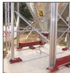
Silos con células de carga