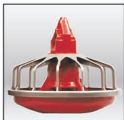
Comedero MODELO C2® PLUS bajo