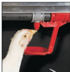
Bebedero de nipple con recuperador